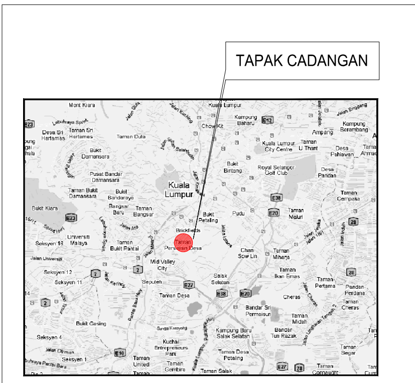
PELAN KUNCI SKALA :